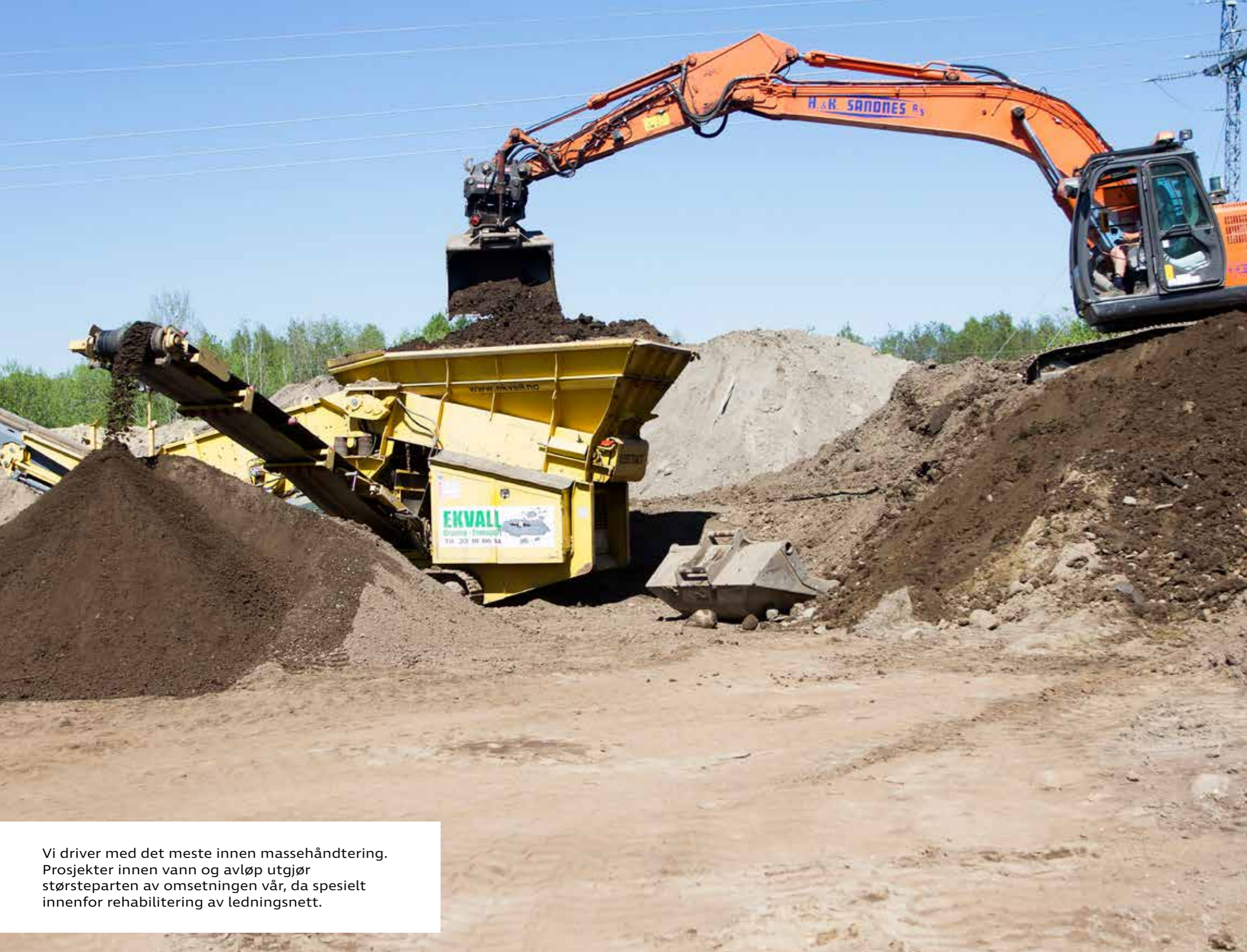
Vi driver med det meste innen massehåndtering. Prosjekter innen vann og avløp utgjør størsteparten av omsetningen vår, da spesielt innenfor rehabilitering av ledningsnett.