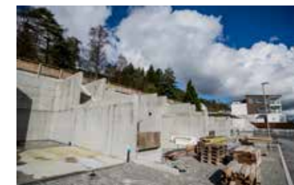
Klatrevegg: Støttemur for et boligfelt på Åsveien.

Høylandsgata 4, 4306 Sandnes www.oh-entreprenor.no