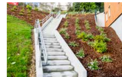
Trapper: Terrengtrapp på Åsveien.