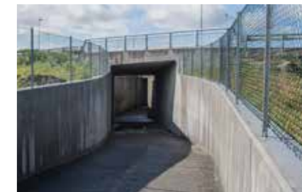
Kulvert: Kultverten på Aase Gård.